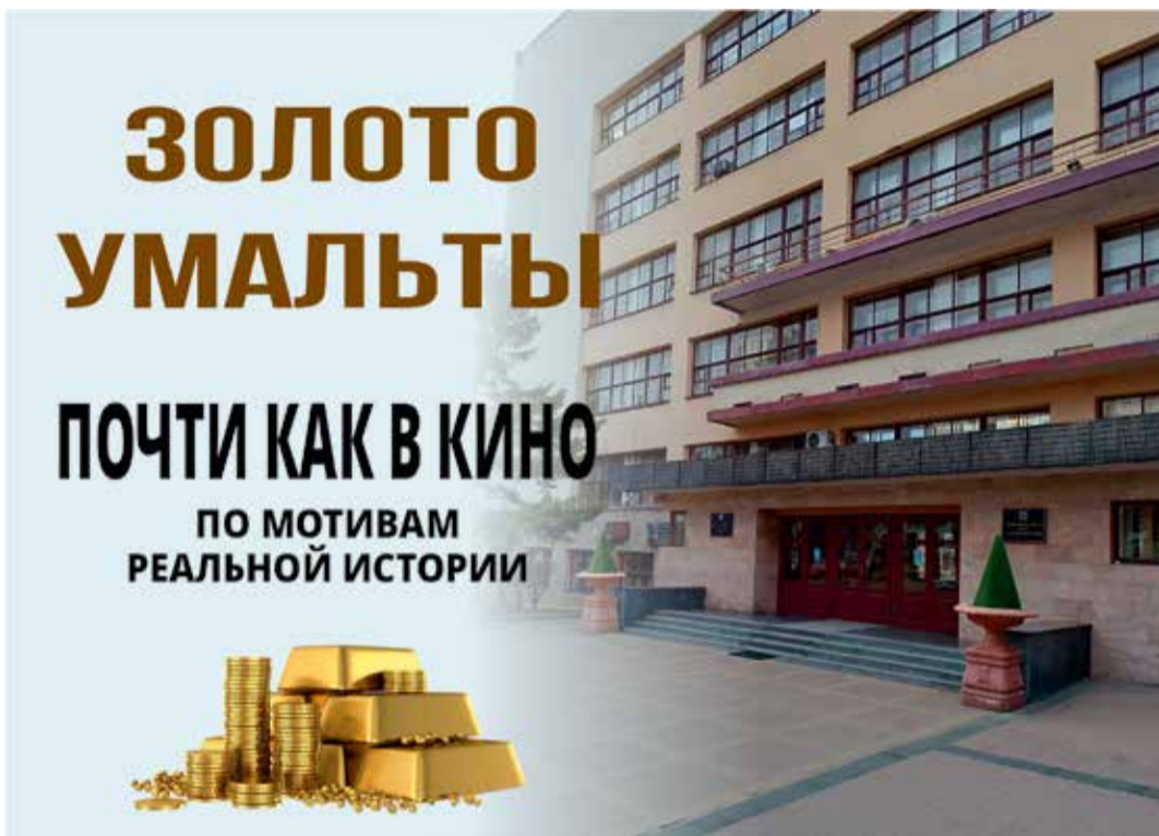
Коллаж А. Шпарейчук

Почему Хабаровский край до сих пор живет так, как будто на него напали и ограбили?