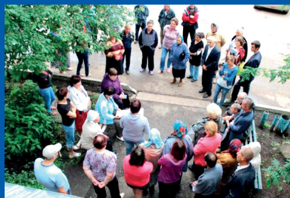
Как жильцам провести собрание с.6