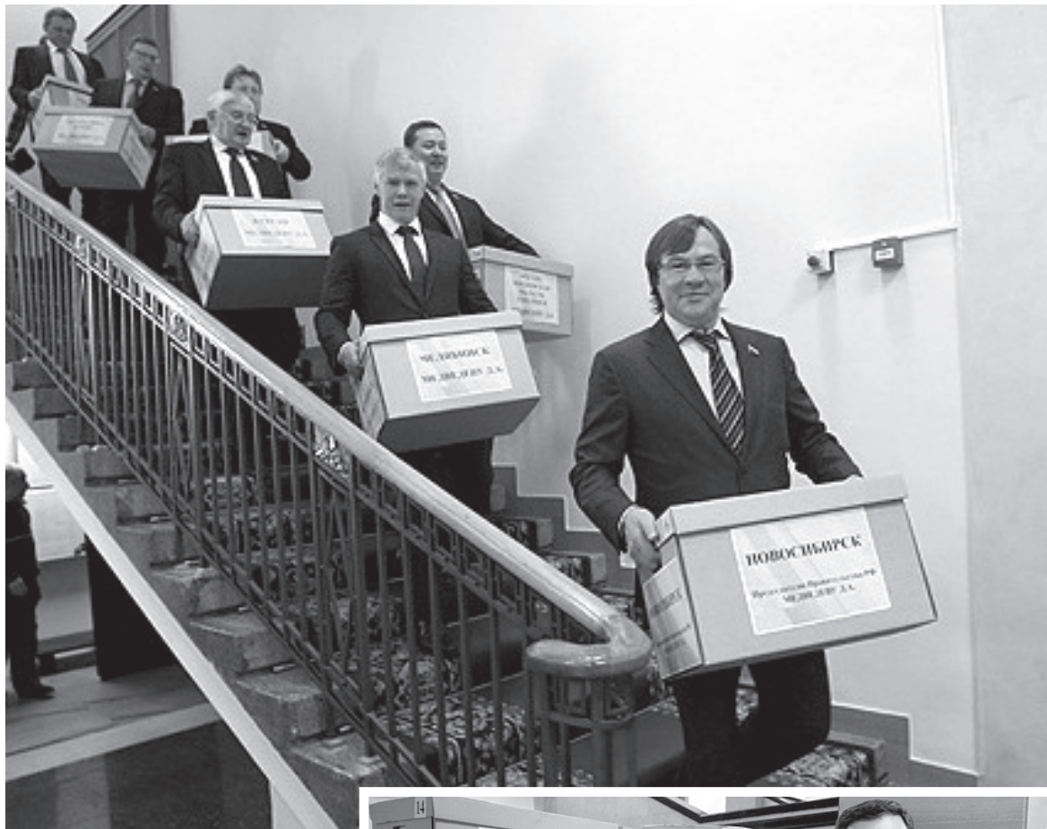
Депутаты-справедливороссы доставили коробки с подписями граждан в правительство страны.

Напомним, что в мае 2015 года, вскоре после того, как в большинстве регионов страны в полную силу заработал закон о