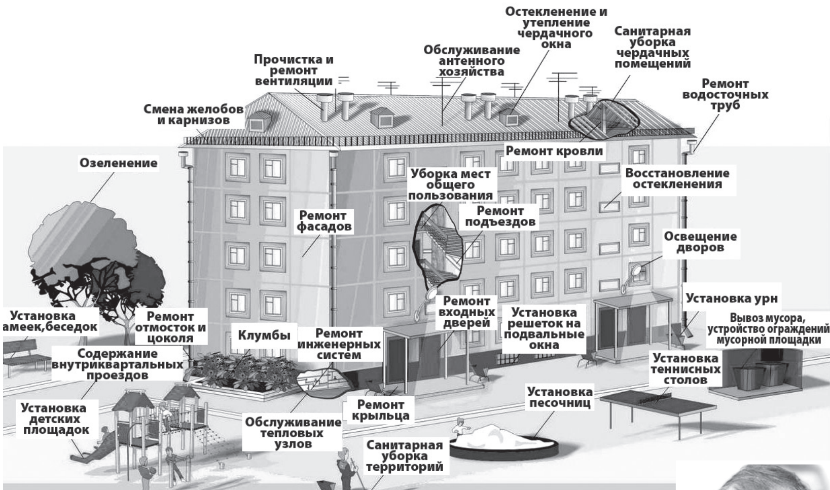
Схема по организации работ по содержанию и ремонту дома.

нятся за прибылью, и многие из участников гонки руководствуются старой ценностью «Не обманешь - не продашь».