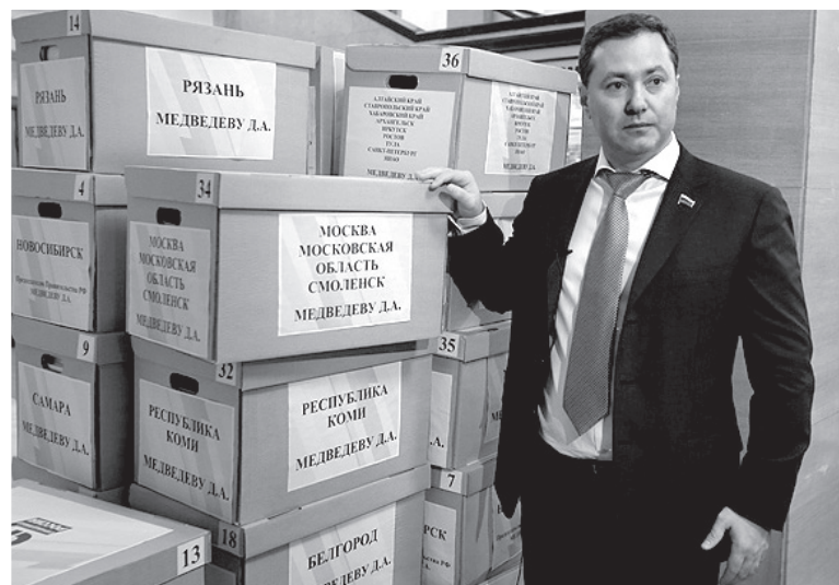
В коробке №36 в правительство страны были переданы сотни голосов жителей Хабаровского края.

Сергей Миронов отметил, что необходимо остановить «поборы с граждан», которые по сути являются «внеплановым налогом». «Капитальный ремонт нужен, но только не за счёт граждан. Государство должно как минимум финансировать, а лучше всего взять эти обязательства на себя», – констатировал политик. Сергей Миронов также выразил надежду на то, что председатель правительства не останется равнодушным к мнению миллиона граждан страны.