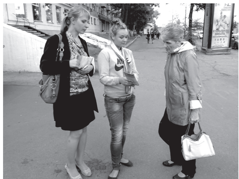
В Хабаровске и других городах региона также велся сбор подписей против поборов на капремонт