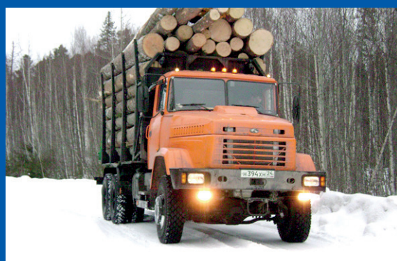
Вернуть лес и рыбу стране! с. 3