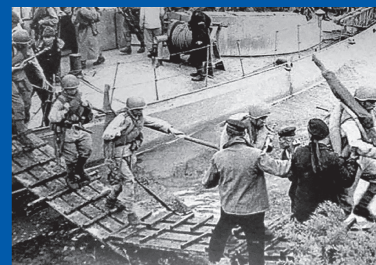
Правда, ставшая историей с.7