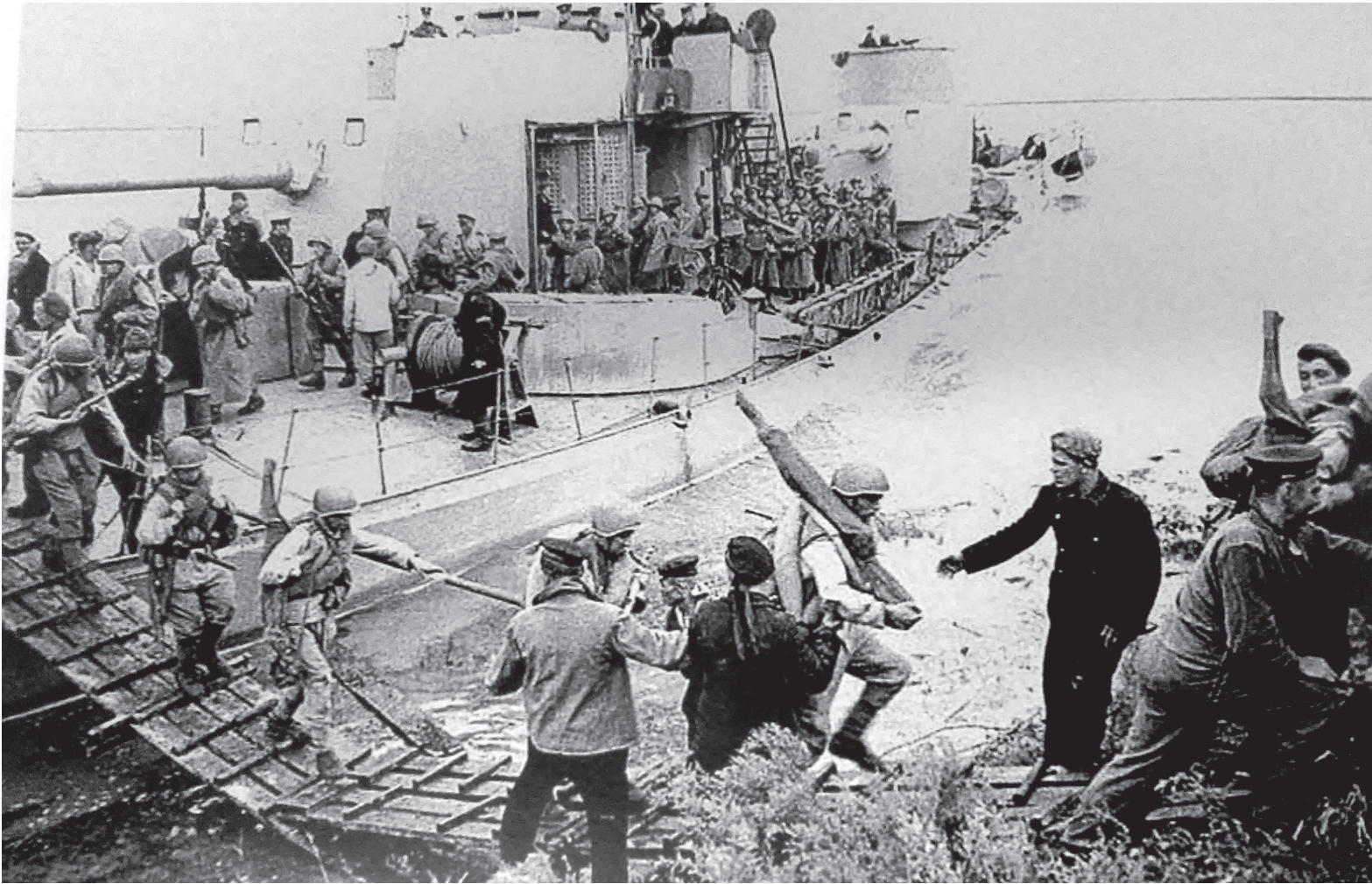
Август 1945 года, монитор Амурской флотилии высаживает десант на реке Сунгари. Это один из мониторов типа «Шквал», построенных еще до революции и три десятка лет составлявших основу боевой мощи флотилии.

Актуальность данного сборника особенно очевидна сегодня, когда предпринимаются попытки пересмотра итогов Второй мировой войны, когда в общественное сознание усиленно внедряется ложный тезис о равной ответственности СССР и фашистской Германии за ее развязывание, когда подвергается сомнению справедливость послевоенного мироустройства, замалчивается правда о жертвах и страданиях, понесенных в годы японской оккупации китайским народом, а целесообразность атомной бомбардировки Хиросимы и Нагасаки по-прежнему объясняется «военной необходимостью». В этом ряду следует рассматривать и бесосновательные притязания японского правительства на острова Малой Курильской гряды».