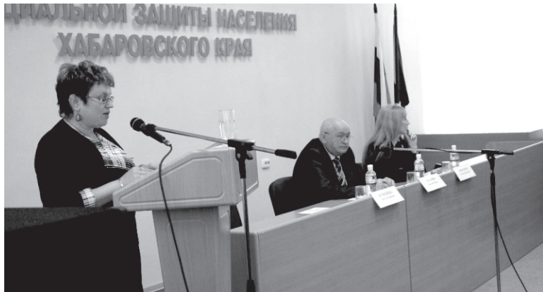
Хабаровское министерство соцзащиты открыто для общения

Но граждане имеют право обратиться за перерасчетом ЕДК в случае изменения платы за жилое помещение и коммунальные