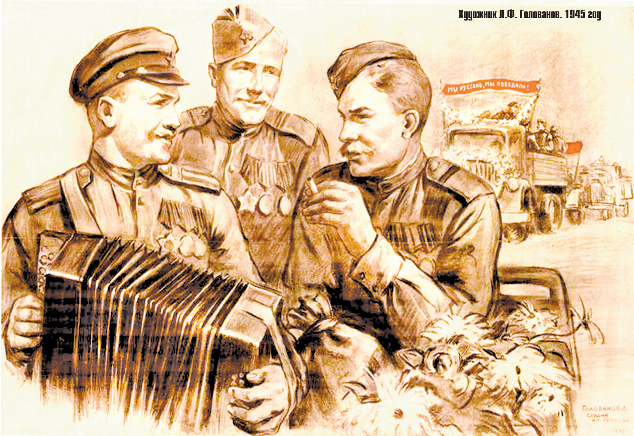
Художник Л.Ф. Голованов. 1945 год